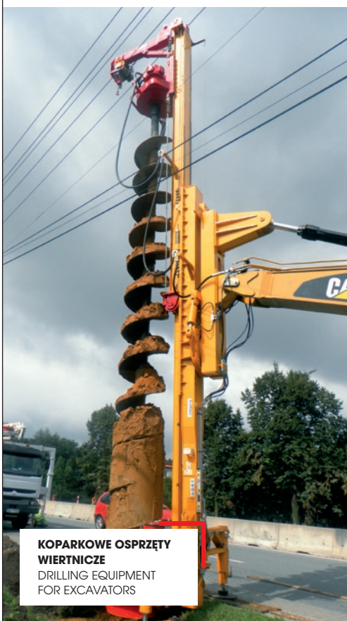
KOPARKOWE OSPRZĘTY WIERTNICZE DRILLING EQUIPMENT FOR EXCAVATORS