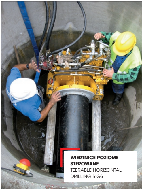
WIERTNICE POZIOME STEROWANE TEERABLE HORIZONTAL DRILLING RIGS