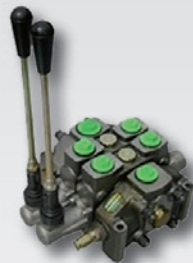
ROZDZIELACZE HYDRAULICZNE HYDRAULIC VALVES