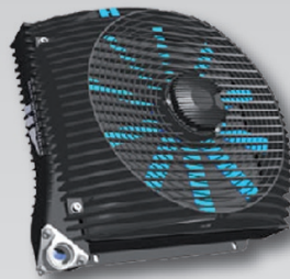
CHŁODNICE OLEJU HYDRAULIC OIL COOLERS