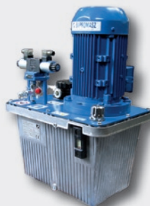
AGREGATY HYDRAULICZNE HYDRAULIC AGGREGATES