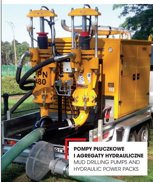
POMPY PŁUCZKOWE I AGREGATY HYDRAULICZNE MUD DRILLING PUMPS AND HYDRAULIC POWER PACKS