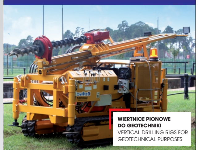
WIERTNICE PIONOWE DO GEOTECHNIKI VERTICAL DRILLING RIGS FOR GEOTECHNICAL PURPOSES

DRILLING EQUIPMENT, HYDRAULIC CYLINDERS AND AGGREGATES MANUFACTURING